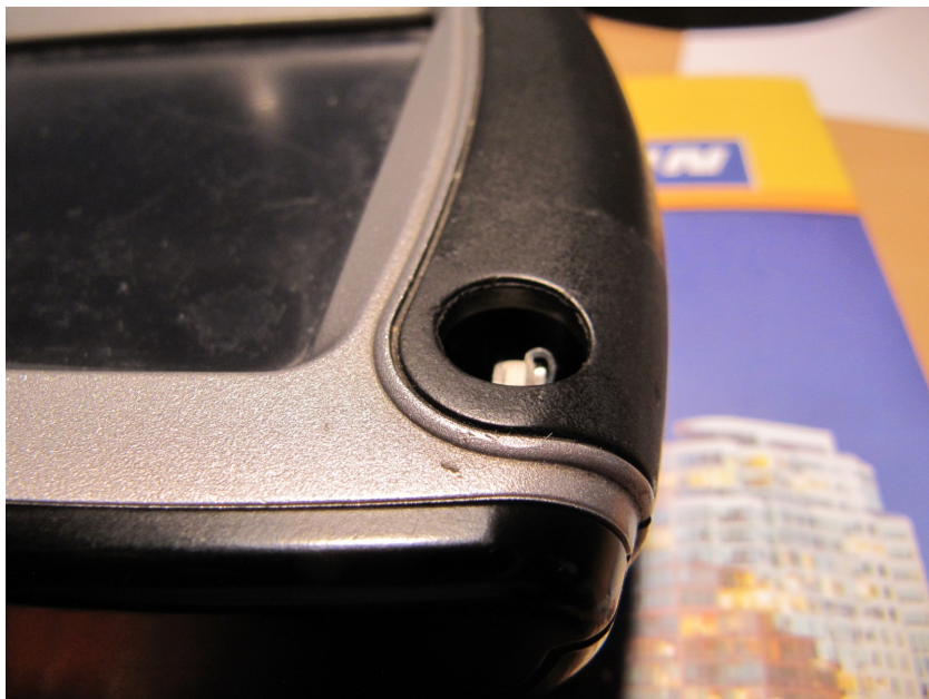
Zūmo 550 - zonder aan/ uit knop

Nou wilde ik ook een kaart van USA/ Canada hebben, met lifetime upgrade.